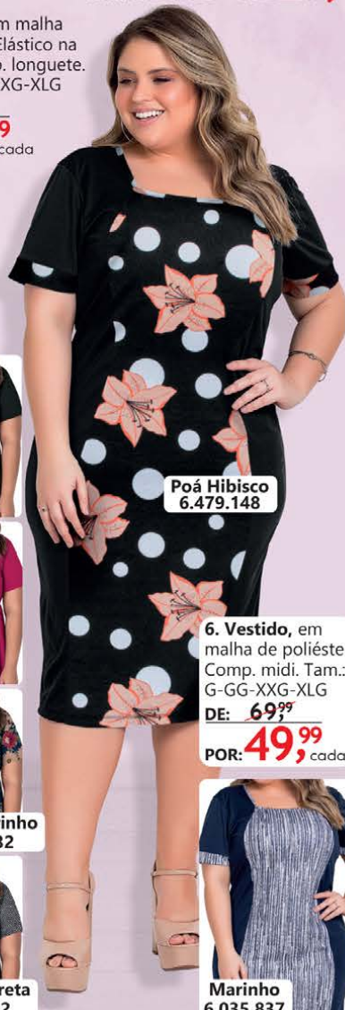
Poa Hibisco 6.479.148

6. Vestido, em malha de poliéster. Comp. midi. Tam.: G-GG-XXG-XLG DE: 69,99 POR: 49,99 cada