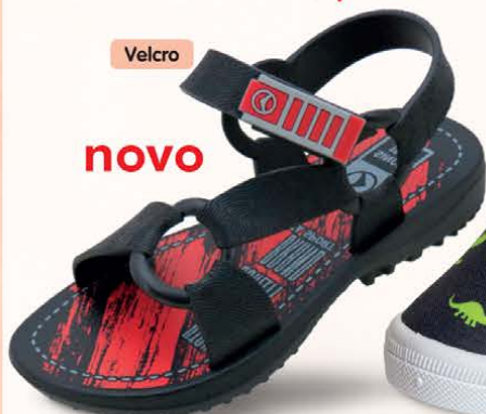
4. Sandália, em PVC. Solado flexível. Tam.: 26-28-30-32-34. Preta 6.603.712