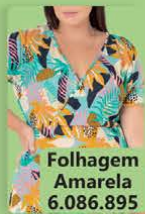
Folhagem Amarela 6.086.895