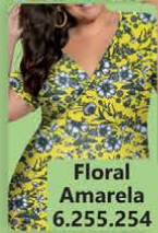
Floral Amarela 6.255.254