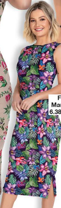
Flor Marinho 6.380.913

4. Vestido, em malha de poliéster. Não acompanha cinto. Comp. longuete. Tam.: P-M-G DE: 49,99