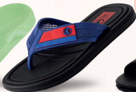
2. Chinelo, em sintético. Solado flexível. Tam.: 26-28-30-32-34. Azul 6.565.845