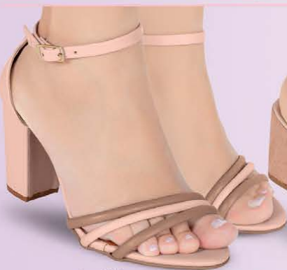
6. Sandália, em sintético. Salto 8 cm. DE: 139,99 Tam.: 34 a 39. POR: 99,99 Rosê 6.148.545