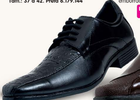
Elástico no Cabedal (Calce Fácil)