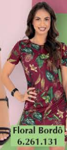
Floral Bordô 6.261.131