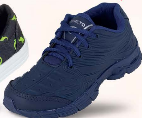
6. Tênis, em sintético. Tam.: 28-30-32-34. Marinho 6.129.188