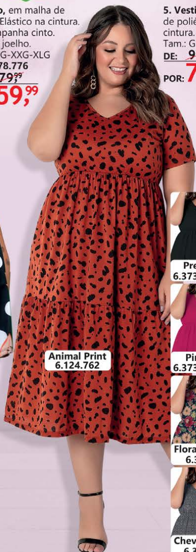
Animal Print 6.124.762

5. Vestido, em malha de poliéster. Elástico na cintura. Comp. longuete. Tam.: G-GG-XXG-XLG DE: 99,99 POR: 79,99 cada