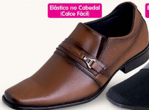
Elástico no Cabedal (Calce Fácil)