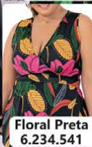
Floral Preta 6.234.541