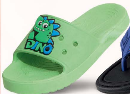
1. Chinelo, em PVC. Solado flexível. Tam.: 26-28-30-32. Verde 6.546.922