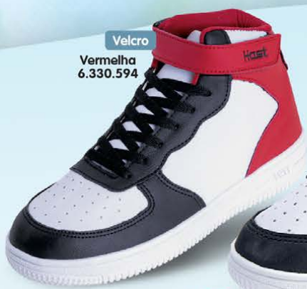
Velcro Vermelha 6.330.594