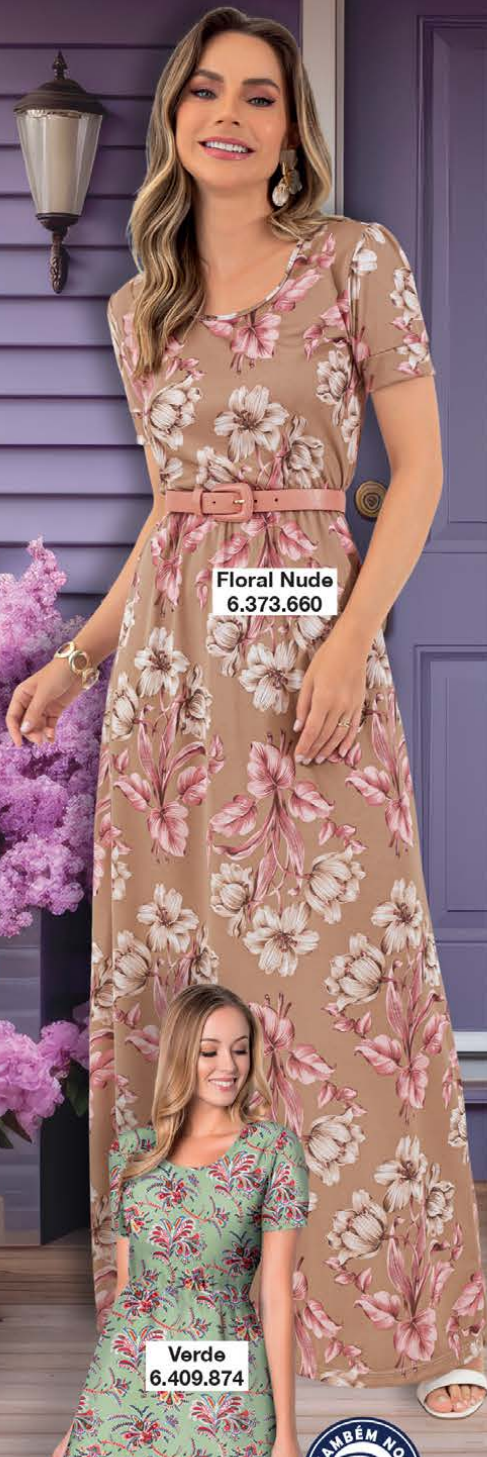
Floral Nude 6.373.660