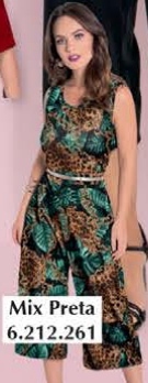
Mix Preta 6.212.261