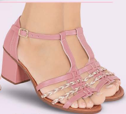
8. Sandália, em sintético. Salto 7 cm. DE: 139,99 Tam.: 34 a 39. POR: 99,99 Rosa 6.358.417